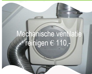
Mechanische ventilatie reinen € 110,-