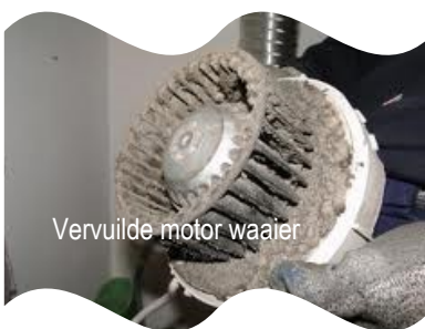
Vervuilde motor waaijer

De ventilatie-unit en motor(en) worden op locatie gereinigd door middel van een speciale vloeistof. Indien nodig worden de lagers vervangen om eventuele toekomstige storingen en/of geluidsoverlast te voorkomen. Als de ventilatie-unit sterk verouderd is, stellen wij voor deze te vervangen om onnodig veel stroomverbruik te voorkomen en een 100 procent gezond binnenklimaat te kunnen garanderen.