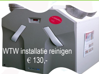
WTW installatie reinigen € 130,-

OF een éénmalige groot onderhoud zonder servicecontract.